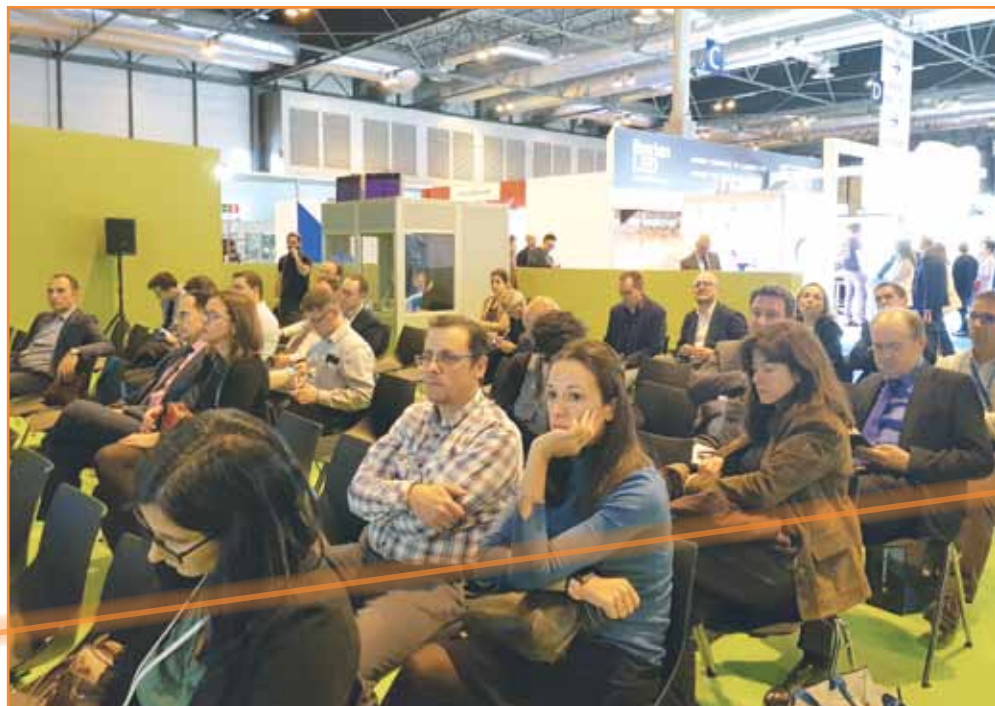
La jornada tuvo lugar en el Techforum de Matelec.

européo de información técnica de clasificación de productos técnicos", por lo que ofrece un estándar abierto para la especificación y agrupación armonizada de productos dirigidos al sector de la instalación a través de un modelo estandarizado de clasificación de productos, utilizando, según Habets, "clases de productos, características,